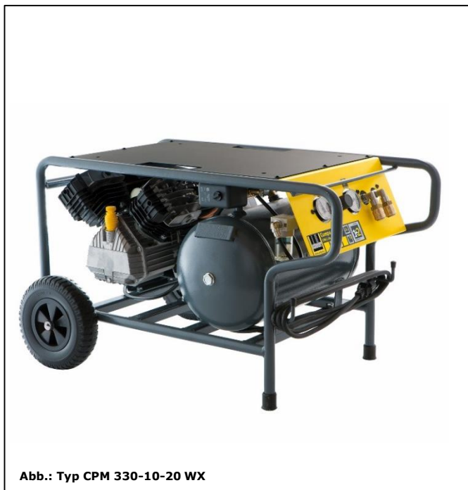
Abb.: Typ CPM 330-10-20 WX