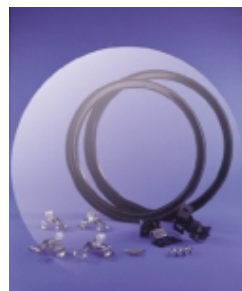
Spannschelle für die Plastiksäcke