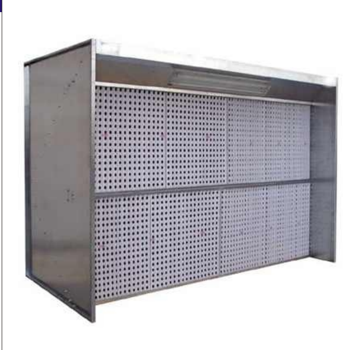
Abbildung: Ausführung NA ohne Seitenwände

Absauganlage für : mittleres und großes Lackieraufkommen